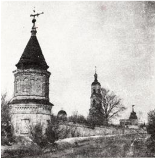
Вид с юго-востока. Фото 1987 года.

По сохранившемуся преданию еще «до разорения литовского» стояла на берегу Вори в Черноголовской волости деревянная приходская церковь во имя преподобного чудотворца Николая Мирликийского.