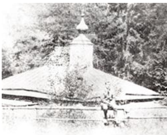
Фото 1922 года.