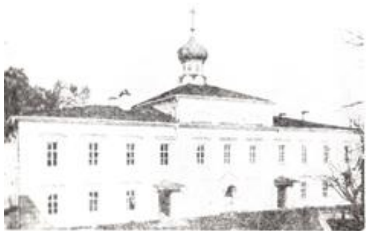
Фото начала XX века.

В середине прошлого века на месте хлебопекарни, в которой была найдена чудотворная икона, строится настоятельский корпус с церковью во имя Всех Святых. Деньги на строительство корпуса и церкви пожертвовал купец Набилкин. Освящена церковь в 1853 году при настоятеле архимандрите Венедикте. Храм занимает центральное место в композиции всего сооружения, имеющего значительную протяженность. Бесстолпный (бесствольный)