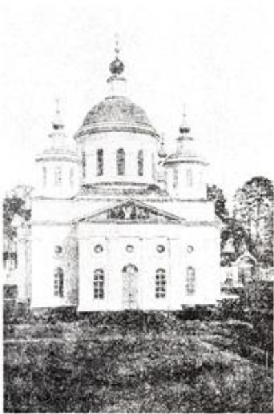
Фото начала XX века.

Соборный храм во имя Христа Спасителя был сооружен в 1842 году специально для чудотворной иконы «Лобзание Христа Иудой» при настоятеле Венедикте. Освящение собора состоялось в 1848 году. В 1860 – 1865 гг. был выполнен штукатурный декор фасадов. Храм выстроен в стиле позднего классицизма с более поздними деталями псевдорусского стиля. Кирпичное оштукатуренное здание покоится на белокаменном подклете. Кубический его объём не имеет аспидных выступов и тем самым ориентируется на все четыре части света; со стороны каждой к нему примыкают плоские притворы. Притворы по фасадам декорированы пилястрами и фронтоном, на котором когда – то было живописное изображение. В стенные проемы между плоскими пилястрами по всему периметру храма располагаются окна в два света: первый составляют окна с полукруглым завершением и килевидными тягами, над ними – второй свет – круглые окна. Венчается храм мощным пятиглавием. Высота основного центрального барабана с полусферическим куполом равна высоте четверика, что несколько утяжеляет храм. Над центральным куполом – еще один световой барабан, на котором уже установлена главка с крестом. Остальные четыре главы имеют основания в виде восьмериков, поставленных в два яруса.