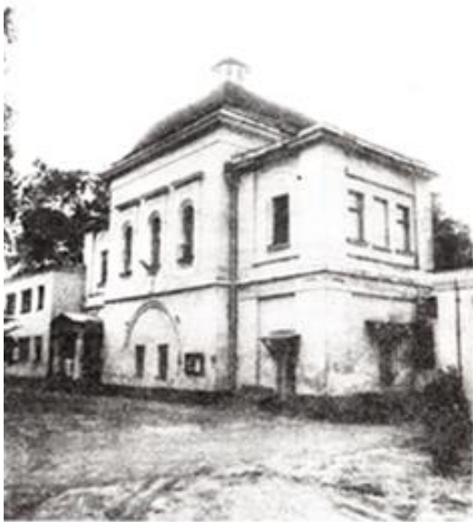
Фото 1985 года.

В последнее время ведутся интенсивные переговоры о выселении из зданий монастыря психиатрической больницы и возобновлении здесь монастырского общежития, что и позволит восстановить неординарный памятник российского зодчества и вернуть прежнюю славу отечественной святыне.