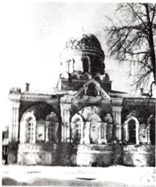
Фото 1989 года.